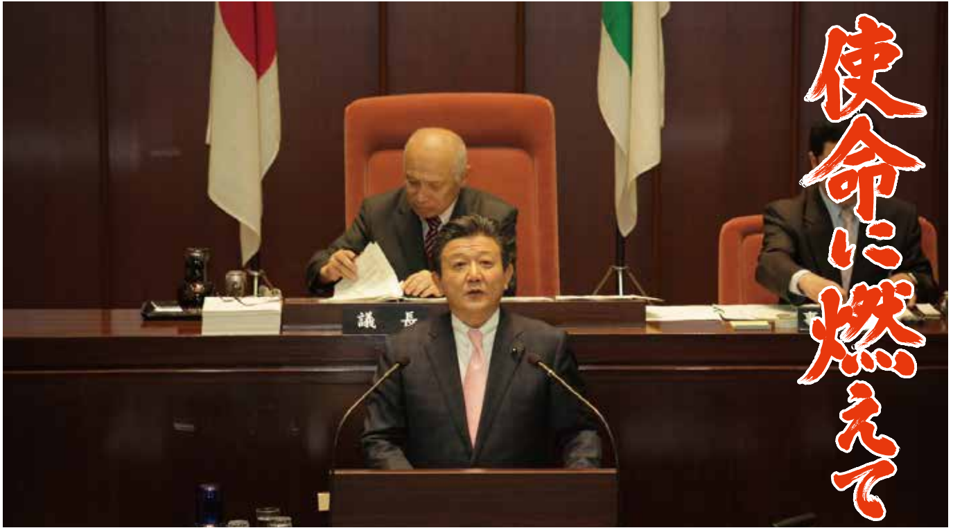
自民党を代表して、2月定例会総括質問