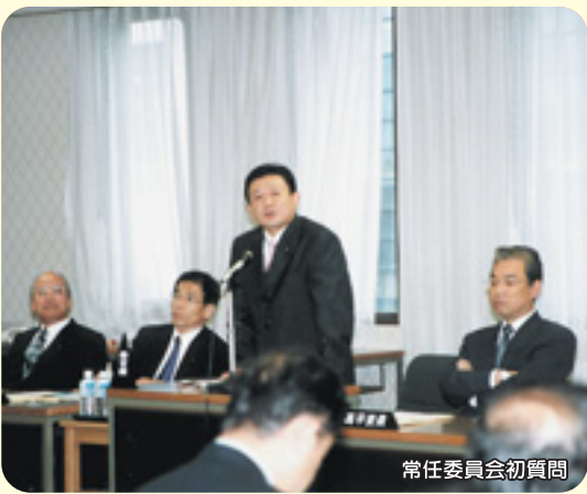
常任委員会初質問