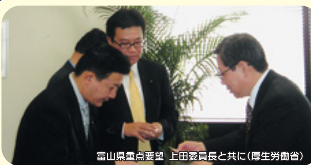
富山県重点要望 上田委員長と共に(厚生労働省)