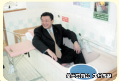
常任委員会 九州視察