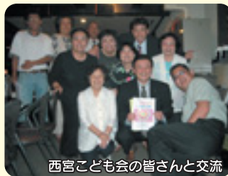
西宮こども会の皆さんと交流