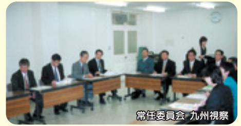
常任委員会 九州視察