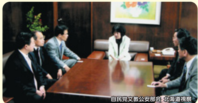
自民党文教公安部会 北海道視察