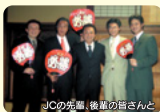
JCの先輩、後輩の皆さんと