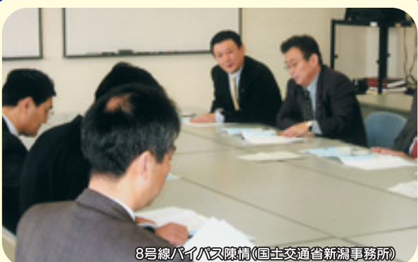
8号線バイパス陳情(国土交通省新潟事務所)