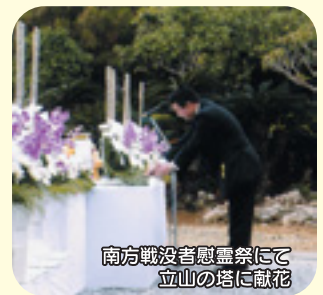
南方戦没者慰霊祭にて 立山の塔に献花