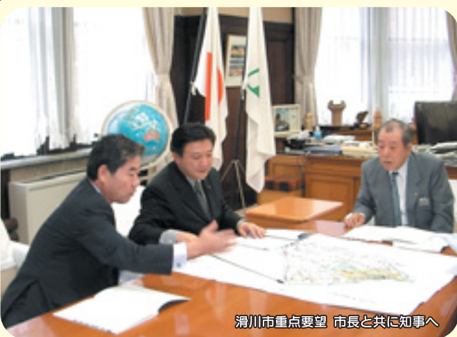
滑川市重点要望 市長と共に知事へ