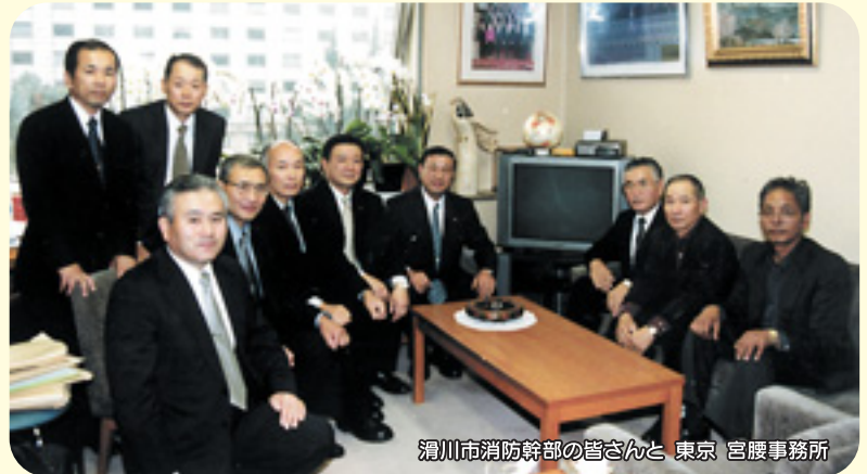
滑川市消防幹部の皆さんと 東京 宮腰事務所