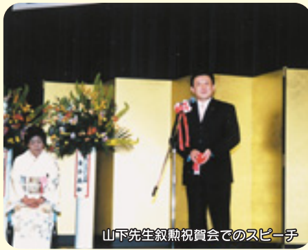
山下先生叙勲祝賀会でのスピーチ