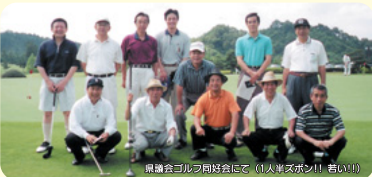
県議会ゴルフ同好会にて (1人半ズボン!! 若い!!)