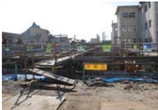
滑川高校海洋科実習棟建設