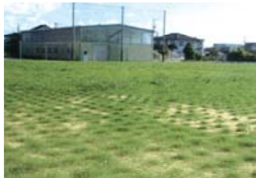
滑川高校第2グラウンド 芝生化