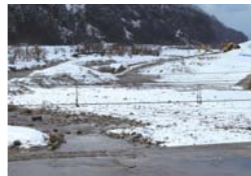
早月川低床護岸工事(蓑輪地内)