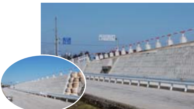
陸橋歩道の設置(辰野地内)