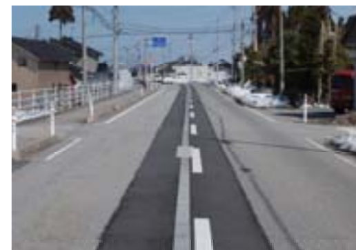
消雪工事(中野島地内)