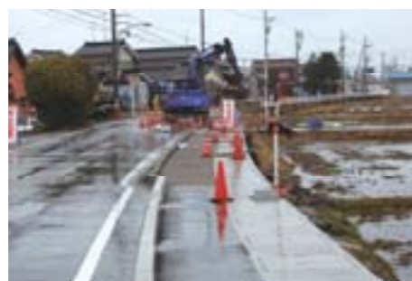
道路改良工事(上島地内)