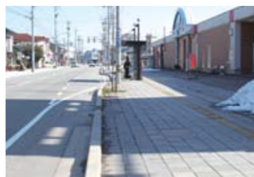
歩道リフレッシュ(常盤町地内)