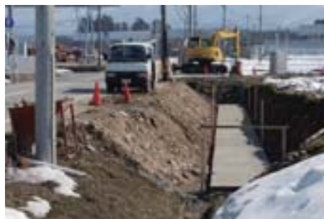
県道の拡幅(北野地内)

この8年間、議会定例会後に地区毎に開催してきた 県政報告会(108回実施)・県政ミーティング(80回実施) や、また町内会単位で開催してきている 県議と語る会(204回実施) において、頂いた 生活基盤整備のご要望にしっかりと取り組んできました。