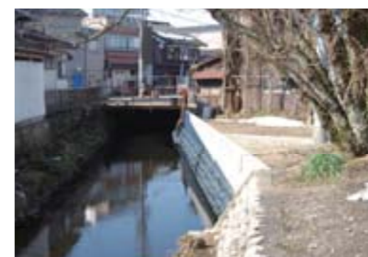
河川改修(2級河川 中川)