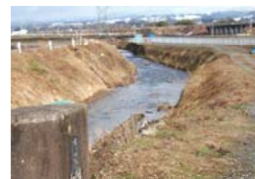
郷川土砂しゅんせつ