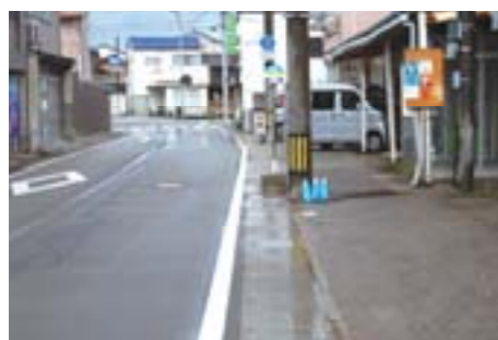
側溝整備(常盤町~瀬羽町地内)