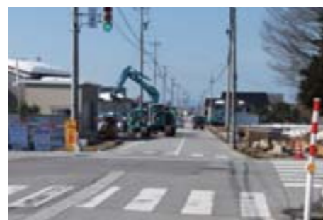
道路改良工事(野町~大島新地内)