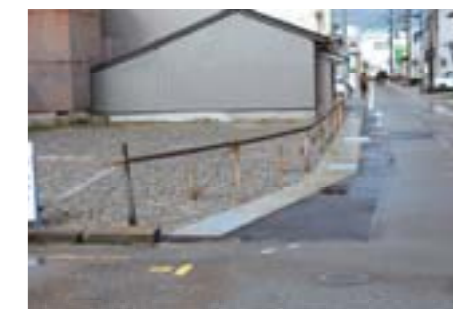
側溝整備(さらしや地内)