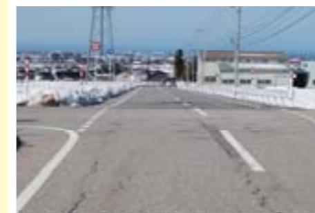
県道の拡幅(森野新地内)