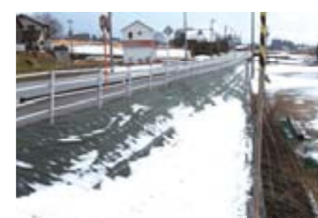
道路法面整備(東加積小グラウンド側)