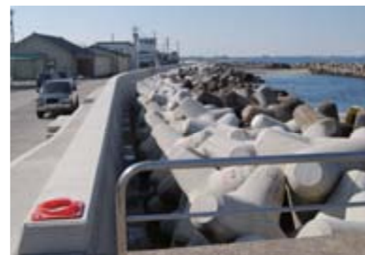
海岸保全工事(常盤町地内)