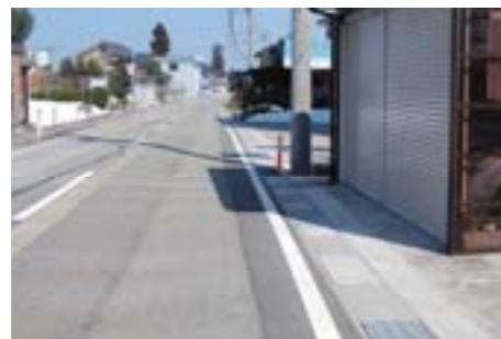
排水路整備(追分~四ツ屋地内)