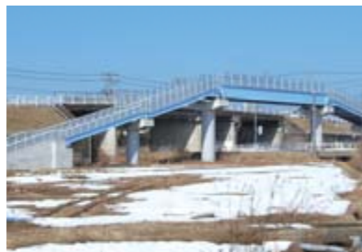
跨線橋設置(加島町菰原地内)