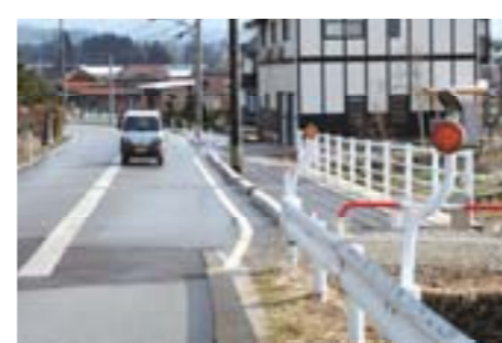
道路改良(本江地内)